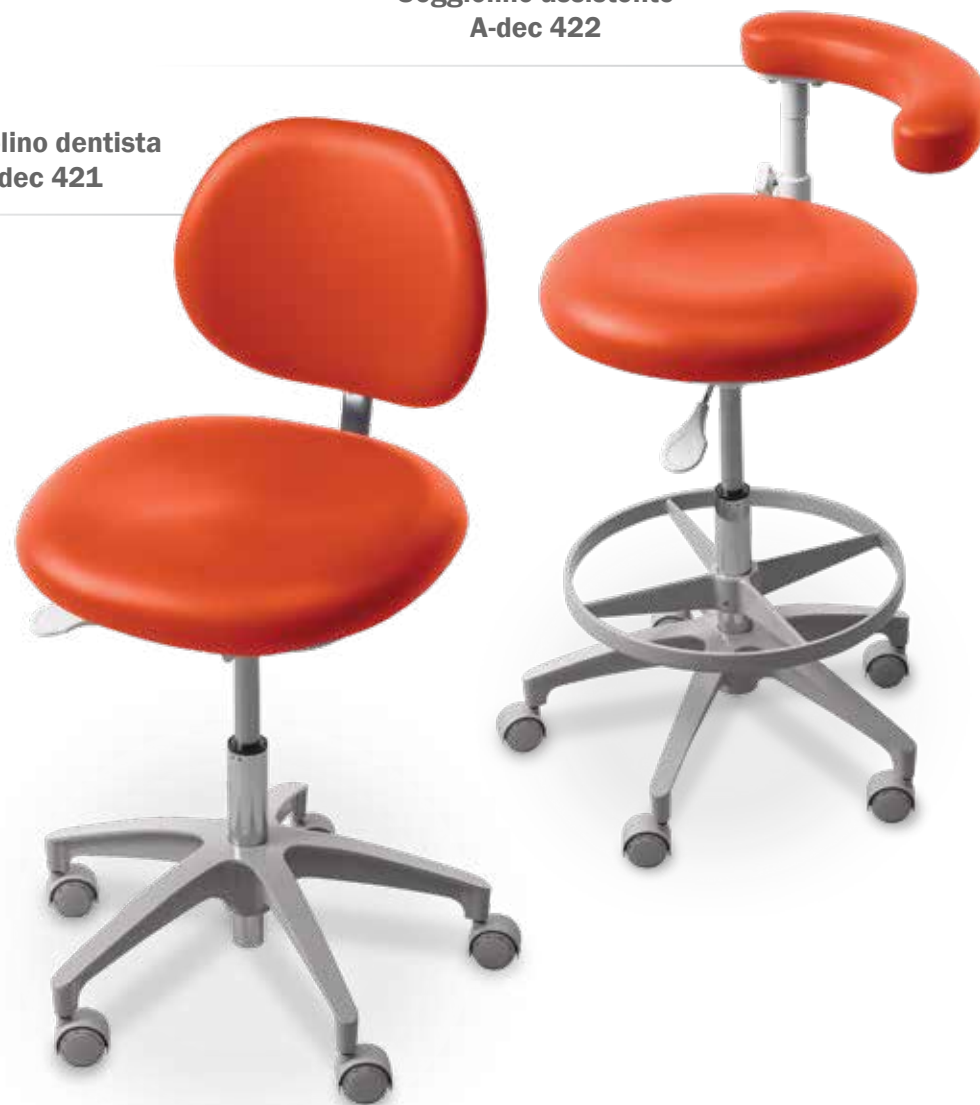
Seggiolino dentista A-dec 421