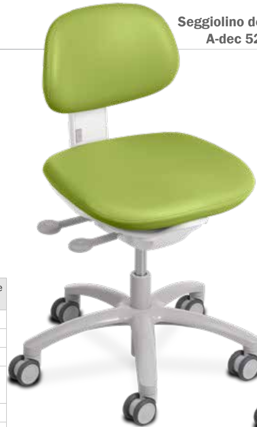
Seggiolino dentista A-dec 521