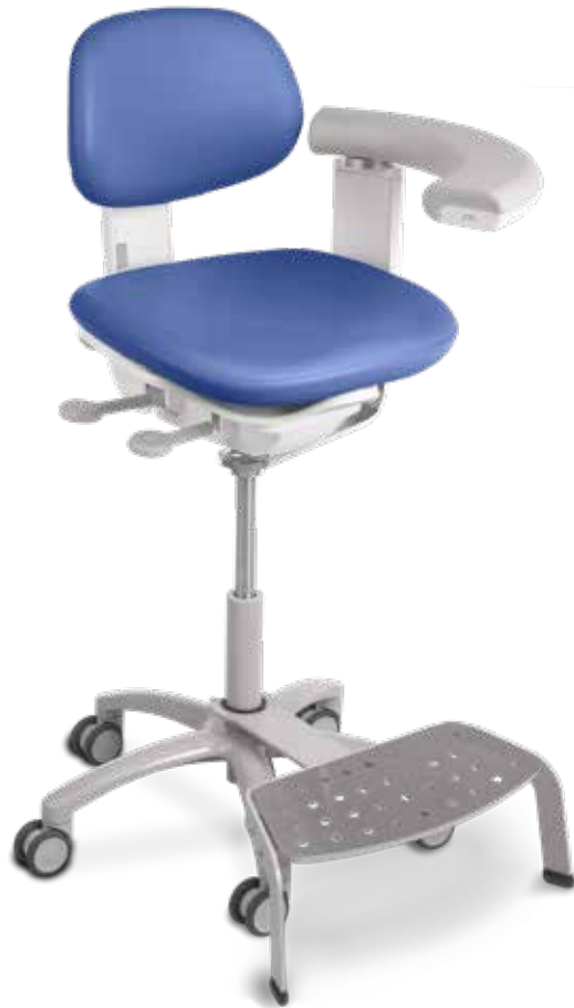
A-dec 522 歯科助手用ツール (オプションの フットペDESTALと背板つき)