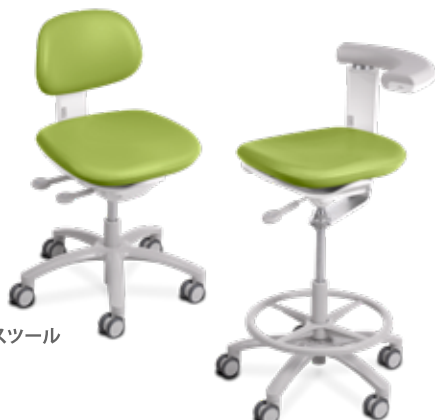
A-dec 521 歯科医師用ツール