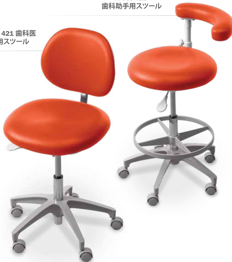
A-dec 421 歯科医師用スツール