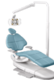
Support à la chaise