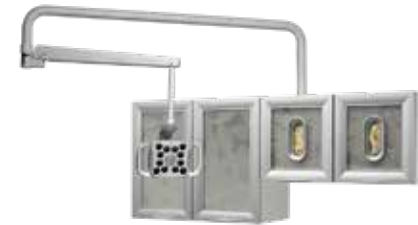
Support mural ou au cabinet