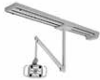
Support sur rail

Il se peut que certaines options ne soient pas disponibles. Communiquez avec votre revendeur pour en savoir plus sur la disponibilité.