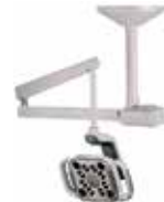
Support au plafond